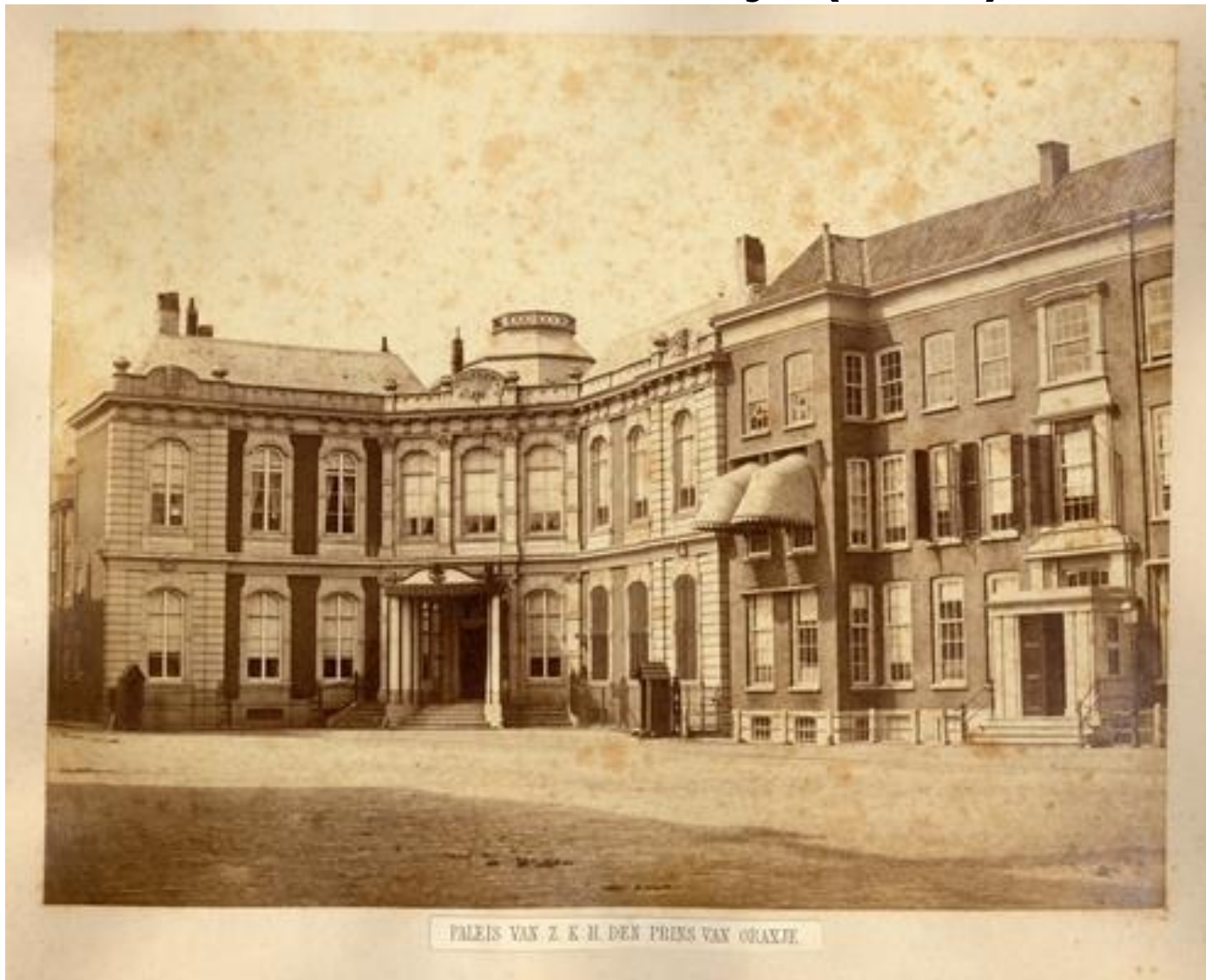
PALEIS VAN Z. K. H. DEN PRINS VAN ORANJE.