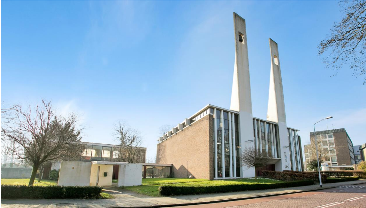
De Fonteinkerk met links De Spreng