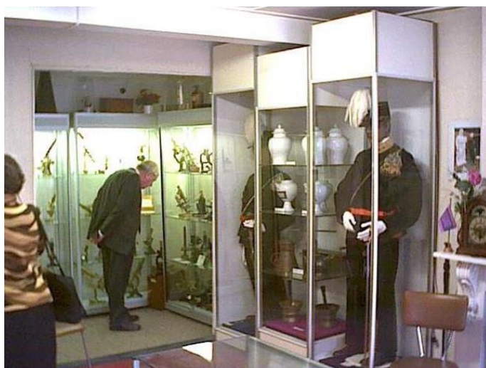
In het Museum