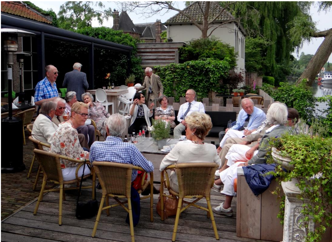
Op het terras van Het Witte Hof.