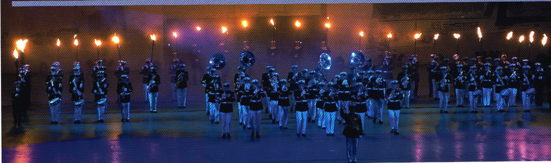
Geëscorteerd door fakkeldragers marcheert de Marinierskapel der Koninklijke Marine het 'paradeplein' van Ahoy op.

Het drill-peloton van de Koninklijke Garde uit Oslo, een lenig team van de Parijse brandweer, een dans- en turngroep uit Canada, een uit meerdere nationaliteiten geformeerde 'massed band pipes and drums', het centraal orkest van het Zwitserse leger, de Nederlandse Douane Harmonie, een Amerikaanse legerband, de Marinierskapel der Koninklijke Marine, de Kapel van de Koninklijke Luchtmacht, het Fanfarekorps Koninklijke Landmacht 'Bereden Wapens', het Fanfarekorps Nationale Reserve plus een aantal showkorpsen van eigen bodem. Ziedaar de 'deelnemerslijst' van de 54e Nationale Taptoe, die van woensdag 24 t/m