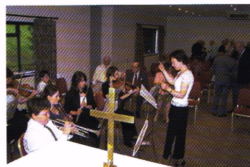
Impressie en foto's: Bob Lodder Gast ter conferentie