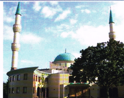
Tijdens de Federatiedag in Tilburg kan o.a. de Suleymaniye-moskee bezocht worden.