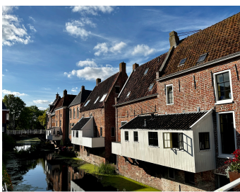
Appingedam, hangende keukens

Op onze agenda staat in september de gebruikelijke Federatiedag : dit jaar in Zwijndrecht. Een veel interessantere stad dan menigeen denkt. Het pro-